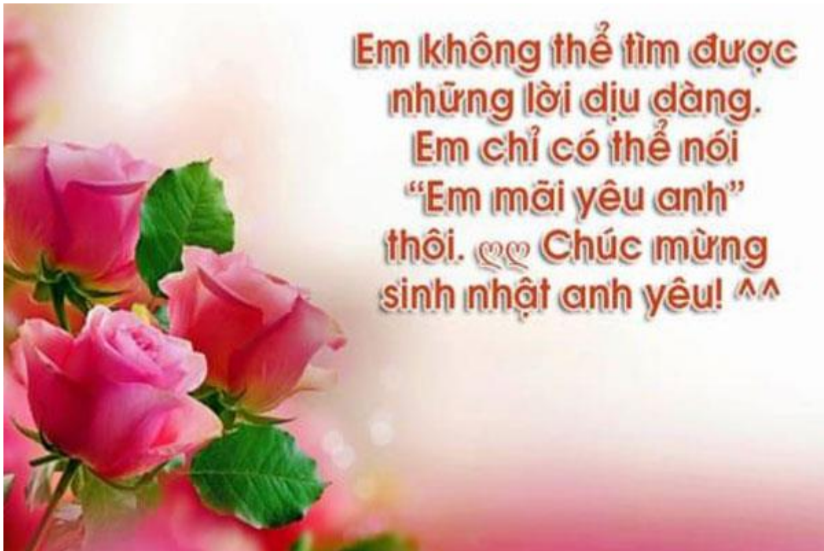
Lời chúc mừng sinh nhật bạn trai lãng mạn nhất